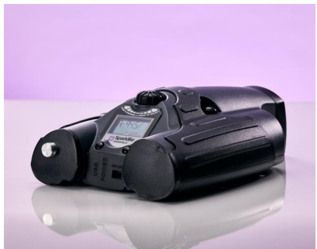
Spectromètre Handheld™ 3.0 de Sparklike